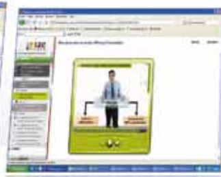
Vidéo Le Prof