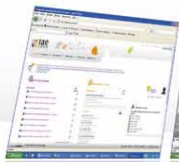
Accueil campus numérique